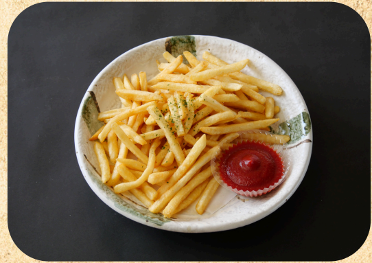
山盛ポテト (250g) 440円(税込)