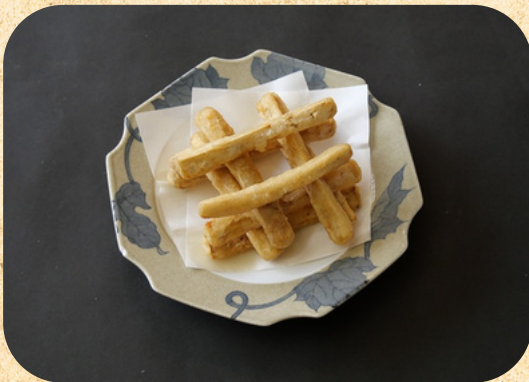
ゴボウからあげ 550円(税込)