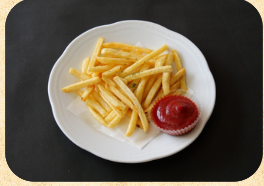
加茂山ポテト (100g) 330円(税込)