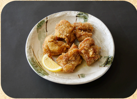
鶏からあげ 660円(税込)