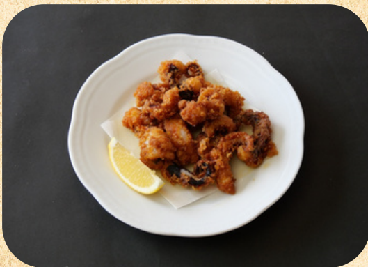
タコからあげ 770円(税込)