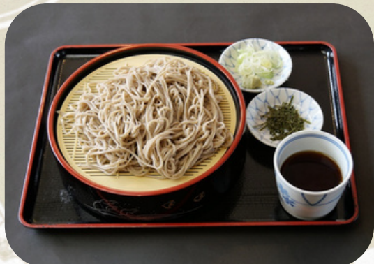
ざるそば 770円 (税込)