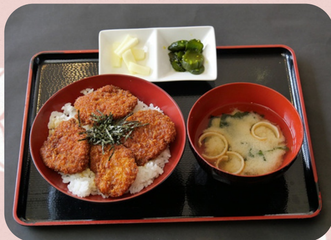
タレカツ丼 990円 (税込)