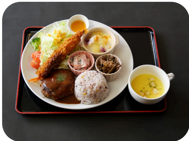
大人様ランチ ¥1680 (税込)