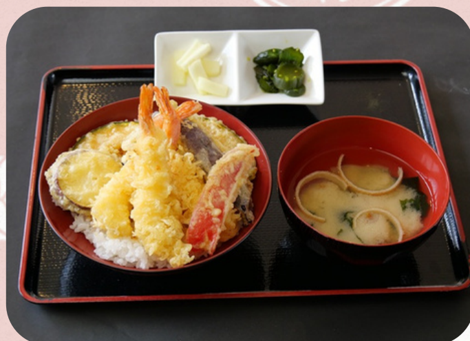
天丼 990円 (税込)