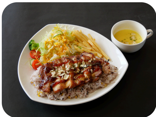
チキンプレート ¥1380 (税込)