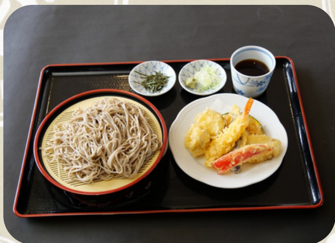
天ざるそば 1380円 (税込)