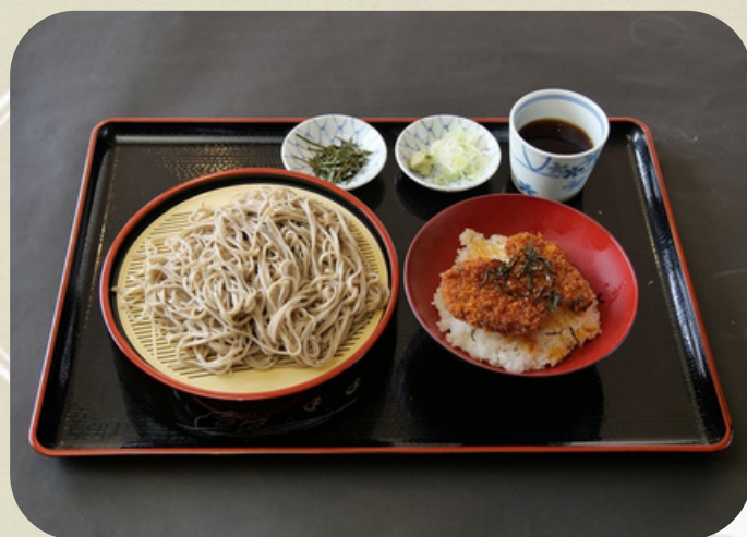
そばタレカツ丼セット 1380円 (税込)