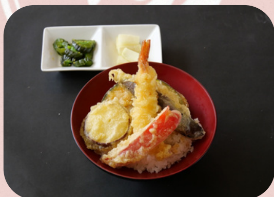
ミニ天丼 660円 (税込)