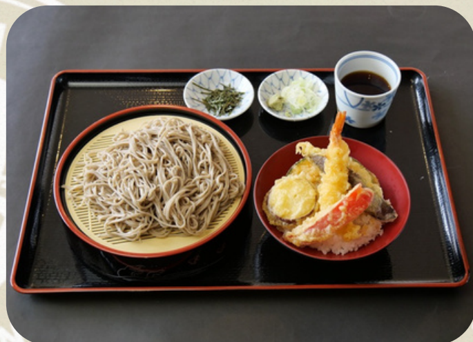
そば天丼セット 1380円 (税込)