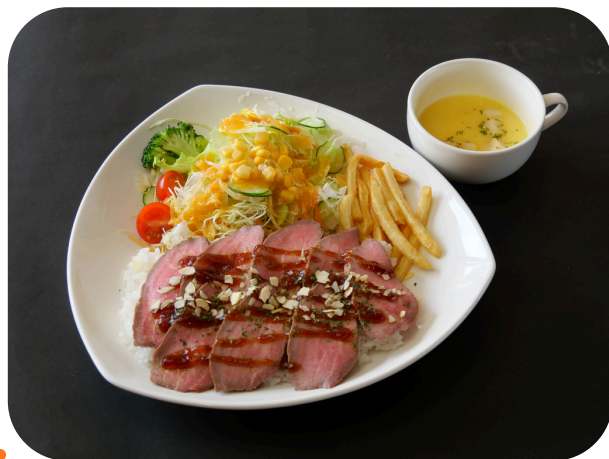
ローストビーフ プレート ¥1380 (税込)