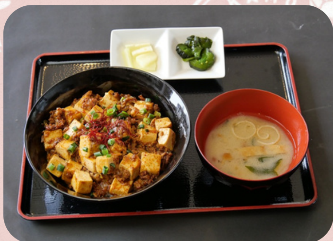
麻婆丼 990円 (税込)