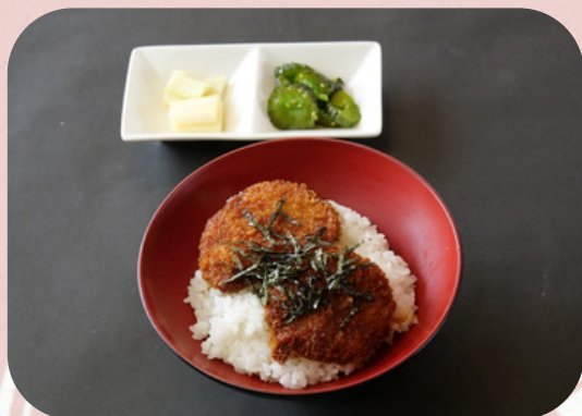
ミニカツ丼 660円 (税込)