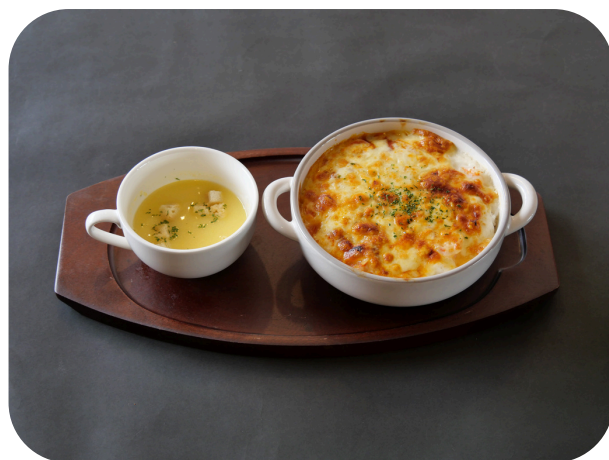
エビドリア ¥990 (税込)