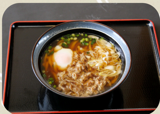
温玉肉うどん・そば 990円 (税込)